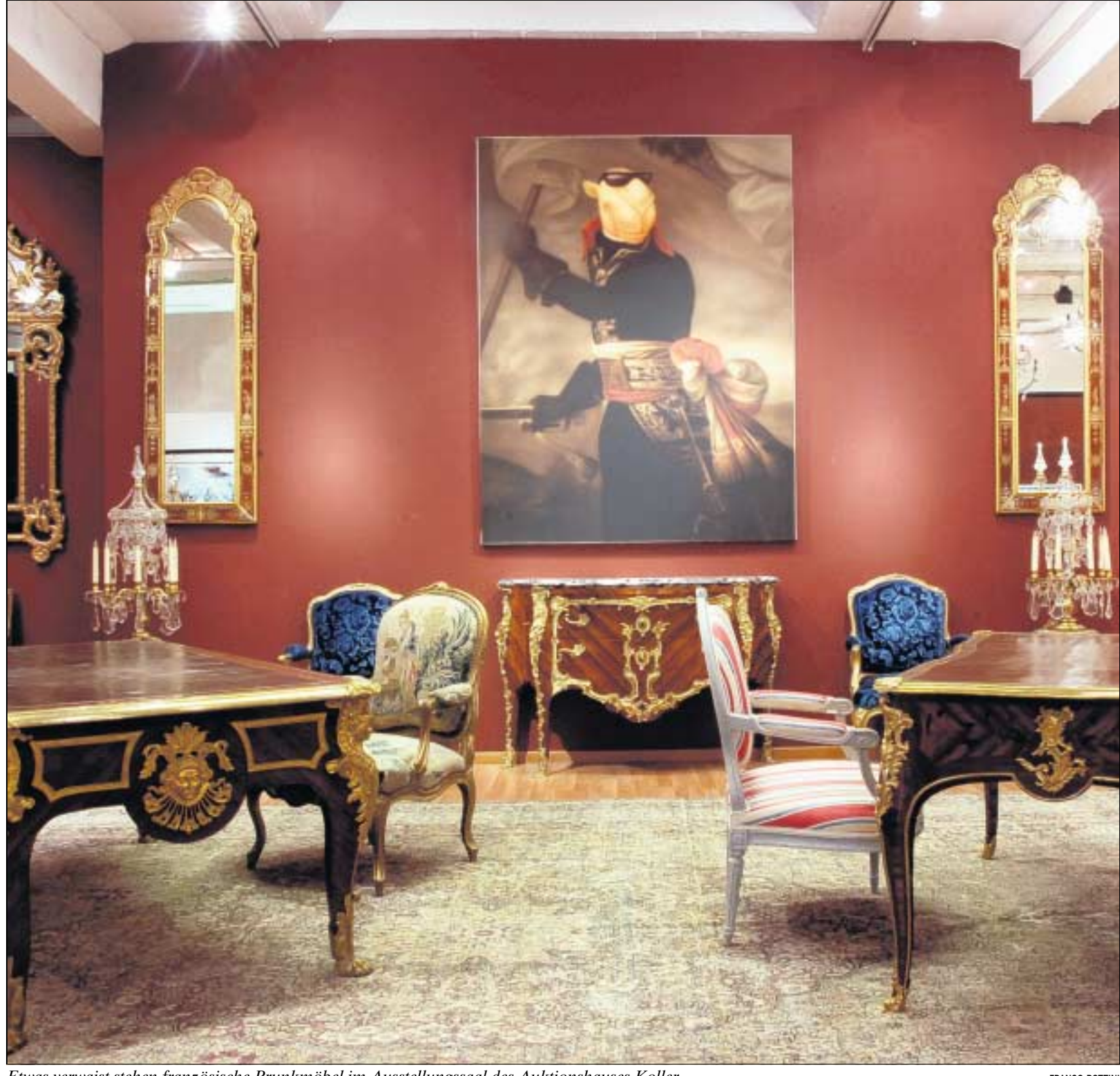
Etwas verwaist stehen französische Prunkmöbel im Ausstellungssaal des Auktionshauses Koller.